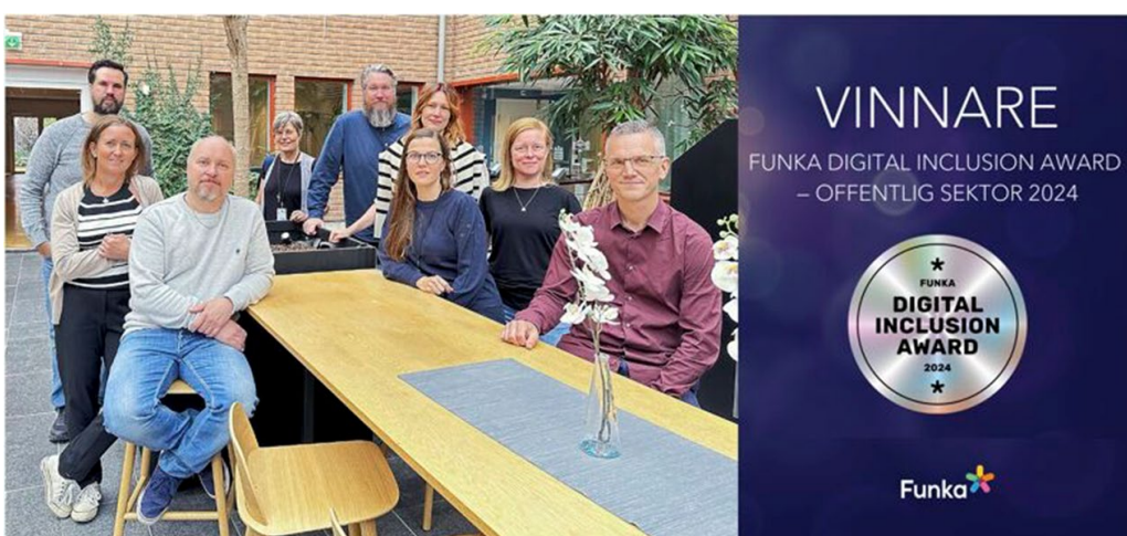
Statens tjänstepensionsverk, vinnare av Funka Digital Inclusion Award 2024

Under 2024 så genomförde vi Funka Digital Inclusion Award för offentlig sektor! Vi hade många fina finalister och vinnaren Statens tjänstepensionsverk (SPV) visade verkligen sin kvalitet.